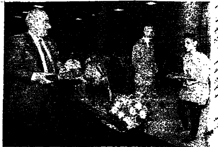
كرامي ورنق في احتفال مدرسة الآباء الكويشيين

قامت مدرسة الكويشيين حفل توعية جوائز على طلاب الصفوف العليا حضره الوزيران عمر كرامي وادوم رنق، النائب زكي مزويدي، محافظ بيروت المهندس جورج سماحة، قنصل عام فرنسا ومجموعة من الاساتذة والشخصيات الامم.